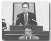
西東京市議会議長を務める