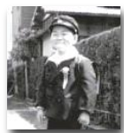
地元、保谷小学校入学