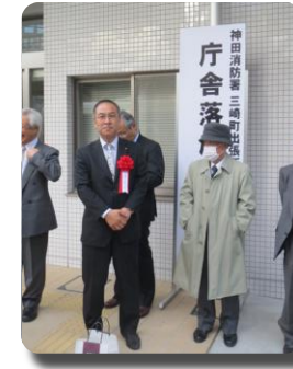
● 東京消防庁神田消防署 三崎町出張所庁舎落成式。

視察させていただいた、金町消防署新庁舎は、災害時における長期間の消防活動に備えるために防災機能を強化した庁舎として、旧庁舎と同一敷地内に建設されており、屋上緑化や太陽光発電設備を設置して環境に配慮した機能を備えています。また、庁舎正面の飛び出したガラス張りの壁面は、江戸町火消の「纏(まとい)の頭(楯など)」を表しており、地域の消防拠点をイメージした外観としたとの説明を受けました。