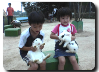
「動物ふれあい教室」※イメージ

今後とも、都教育委員会は、区市町村教育委員会と連携を図り、各小学校における動物飼育等を通じた心の教育を推進していきます。