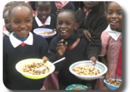
ギゼリとケニアの子どもたち

豆とトウモロコシ、その他野菜を煮込んだ料理。肉入りの少し豪華な物は「スペシャルギゼリ」と呼ばれます。トウモロコシがプリプリしていると大変おいしく感じます。