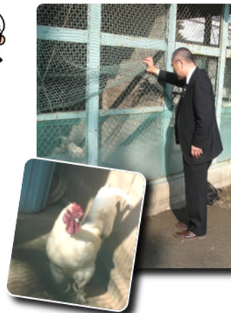
母校、保谷小学校のチャボ小屋とチャボの「こたろう」

都教育委員会は、平成23年度から、獣医師会の協力を得て「動物ふれあい教室」を実施しておりますが、これは、子どもたちが動物と直接ふれあう機会として、大変よい取り組みだと思っております。